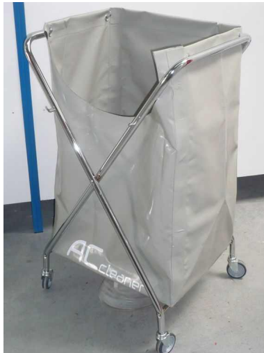
Bac de Lavage